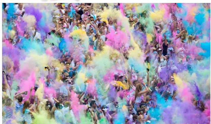
1 medienhaus: nord

Auf dieser Veranstaltung ist jede*r gleich! Die bunten Farben lassen jeden Teilnehmer im gleichen Glanz sein. Da wird es egal welche Hautfarbe oder welche